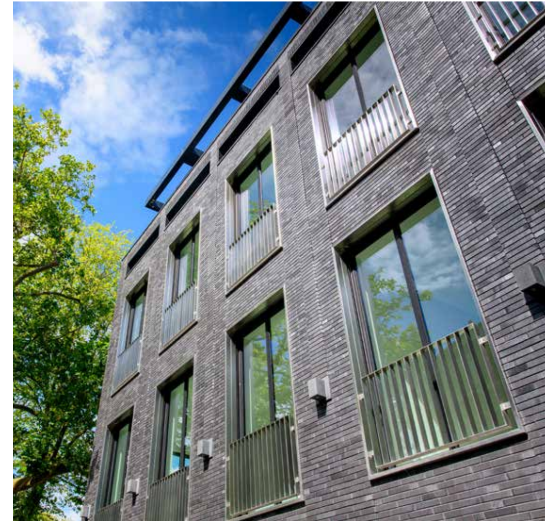
Voor de gevelafwerking zijn speciaal voor dit werk zwarte mangaanstenen gebakken met een gekamde oppervlaktestructuur en een emaille toplaag, die fraai reflecteert in het zonlicht.

De nieuwe kelder biedt ruimte aan een 2-laagse parkeerkelder, 28 bergingen, een wellnessruimte en de complete zwembad- en WKO-installatie. “We hebben gekozen voor een traditionele opbouw met beton”, vertelt De Waal. “Maar ook hierbij kwamen we diverse uitdagingen tegen, omdat de bovenbouw nog in ontwikkeling was.” De afbouw van de kelder en de complete bovenbouw zijn pas in een tweede termijn doorontwikkeld en aangenomen. “De bovenbouw biedt ruimte aan 28 ruime appartementen van 170 m 2 tot 400 m 2 , die casco+ worden opgeleverd. In overeenstemming met de kelder is ook hier gekozen voor een betonskelet, dat zijn stijfheid ontleent aan de lang en ver doorlopende wanden. Verdiepingshoogten tot 4 meter dragen bij aan de chique uitstraling van de appartementen.”